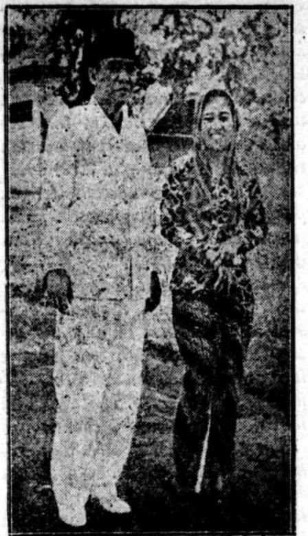
Bung dan Bu Karno

Sewaktu perembukan2 antara Britis dengan AS tentang garishaluan di Timur Djauh ada timbul soal apakah Formosa bisa dipandang sebagai satu wujud jang terpisah, agar bisa dibikin tempat pengungsian (IUP).